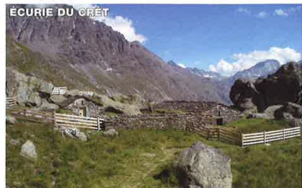
ÉCURIE DU CRÊT