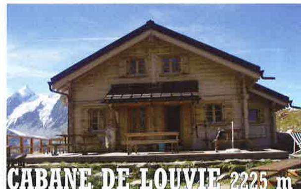
CABANE DE LOUVIE 2225 m

Réservations: Tél. +41 (0)27 778 13 84 www.cabanemontfort.ch