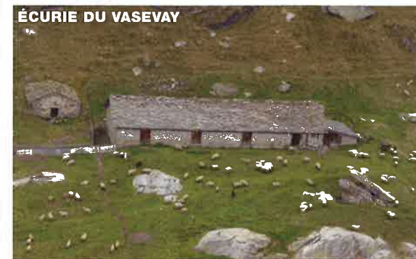
ÉCURIE DU VASEVAY