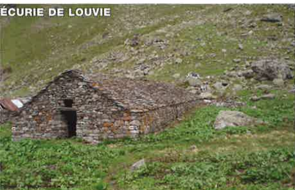
ÉCURIE DE LOUVIE