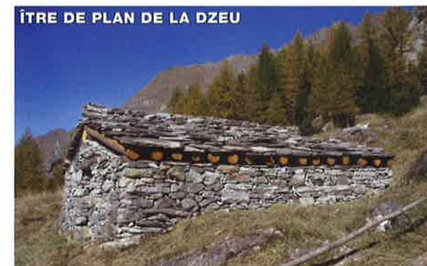
ÎTRE DE PLAN DE LA DZEU