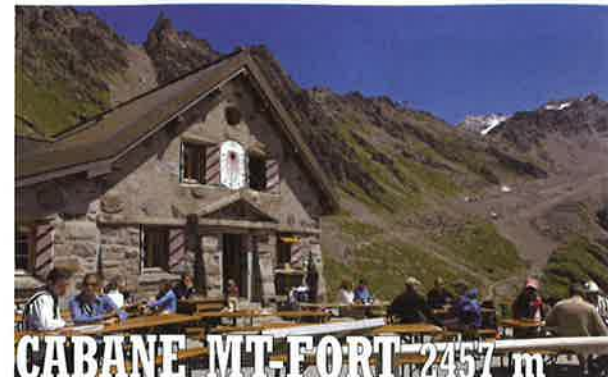
CABANE MT-FORT 2457 m

Refuge de haute montagne (2457 m) dans une nature sauvage et préservée, au départ du Sentier des Chamois, à quelques minutes du Marais de Patiefray, restauration chaude toute la journée et des chambres avec douche à l'étage.