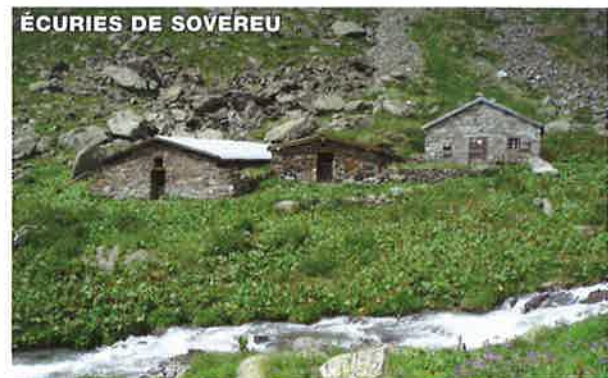
ÉCURIES DE SOVEREU